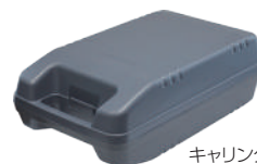
キャリングケース